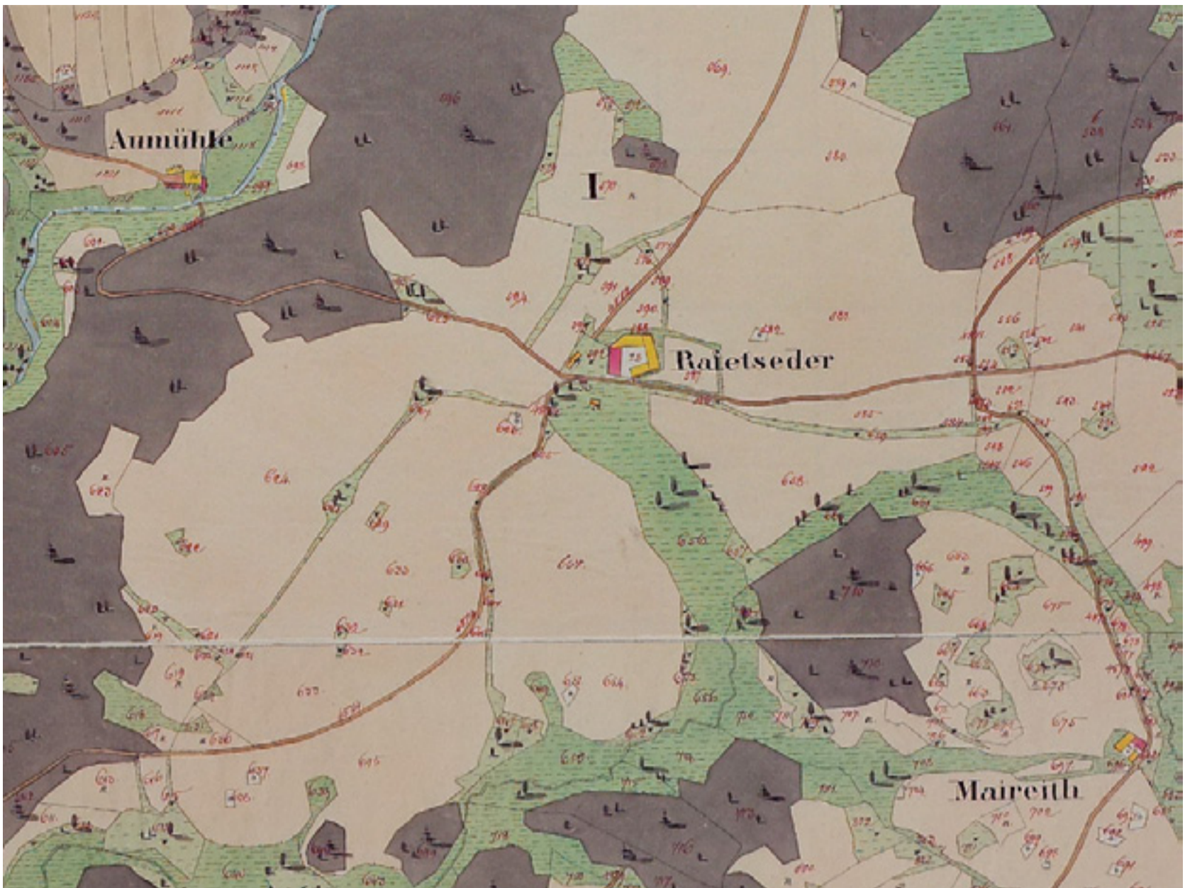
Abb. 3: Lage des Rafetseder-Hofes in der sog. Urmappe des Franziszeischen Katasters um 1825